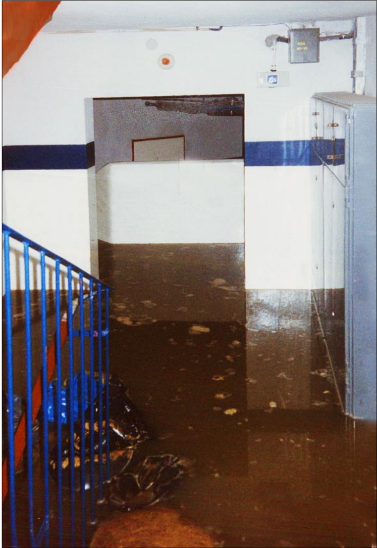
Woda w bramie