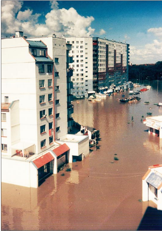
Wszystko pływa jak cały Wrocław