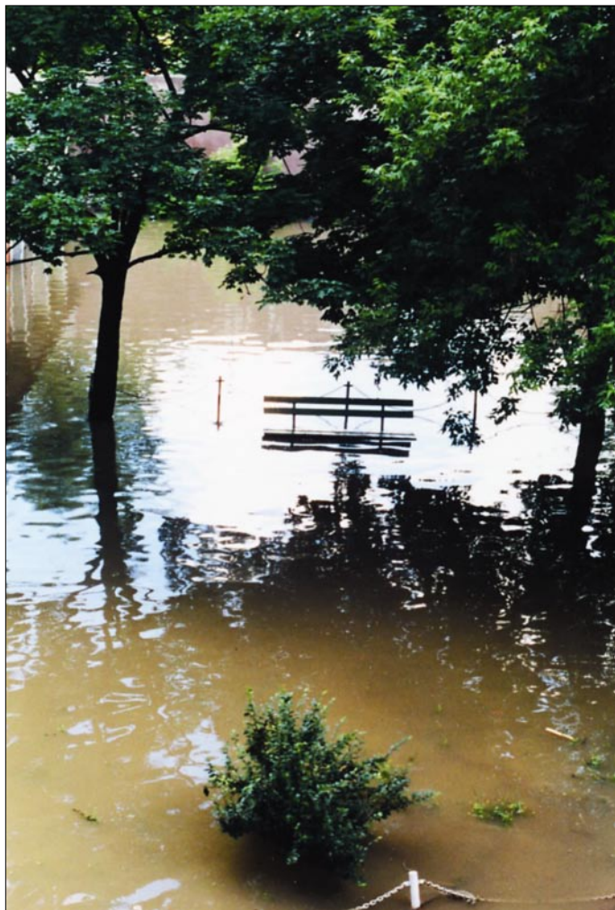
Nasza ławeczka na podwórku