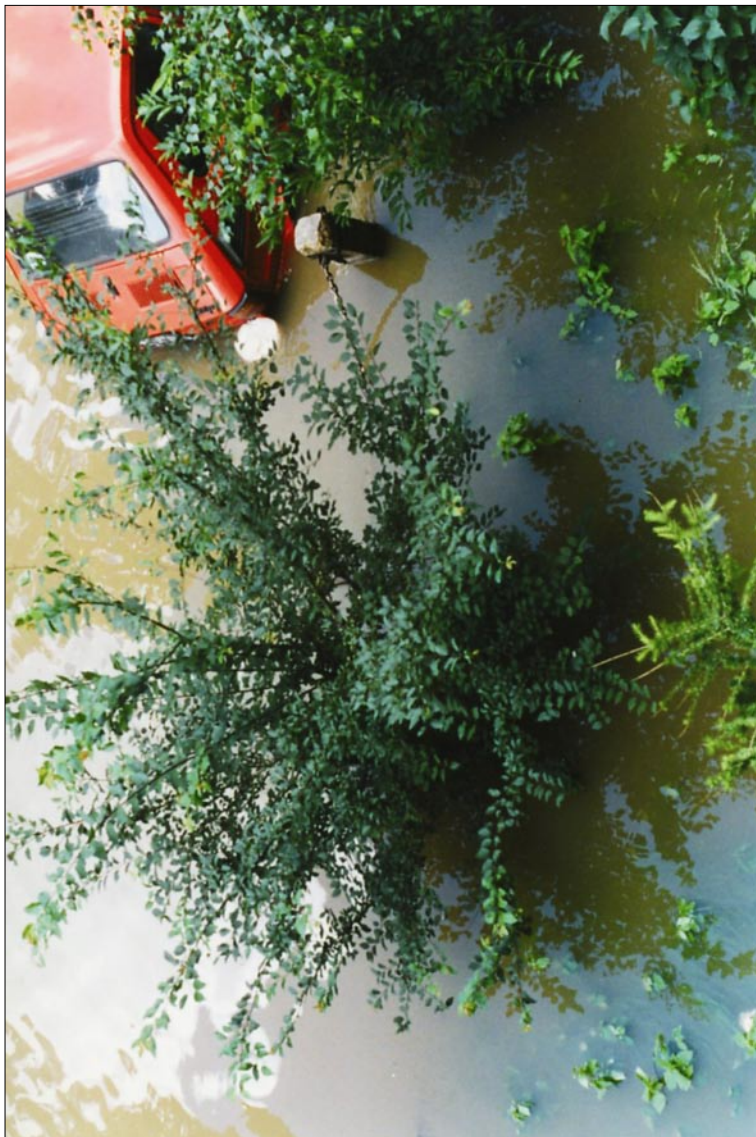
Pod moim domem na Małachowskiego