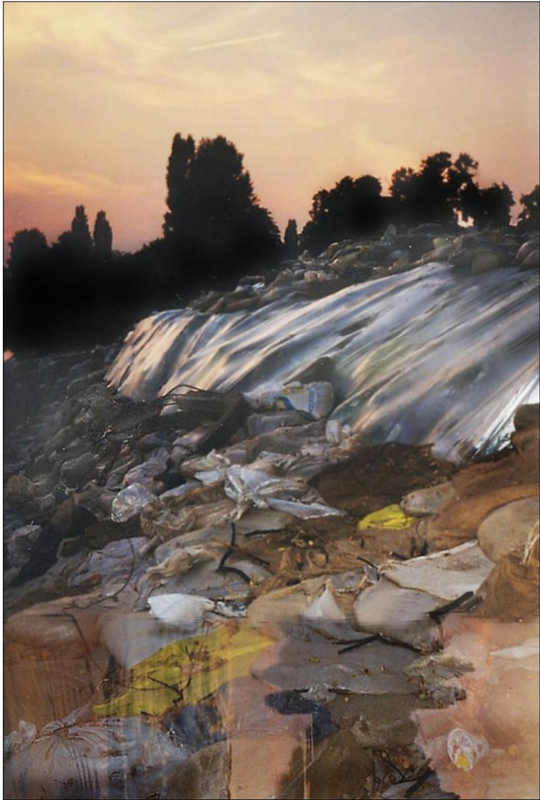
Zachód słońca po powodzi przy ZOO