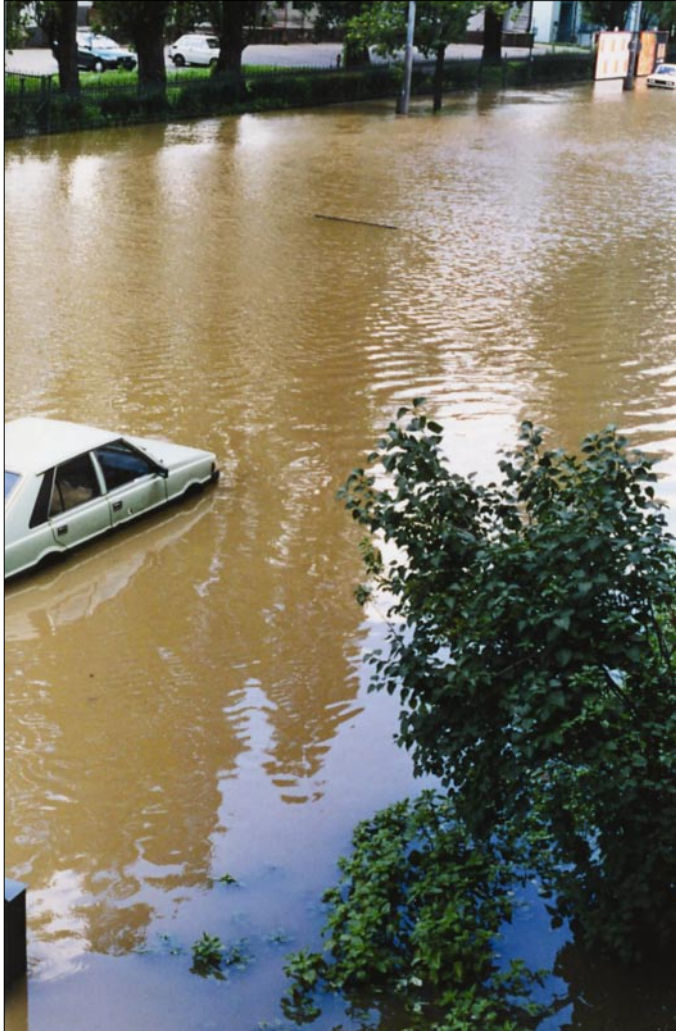
Ulica Małachowskiego blisko dworca głównego