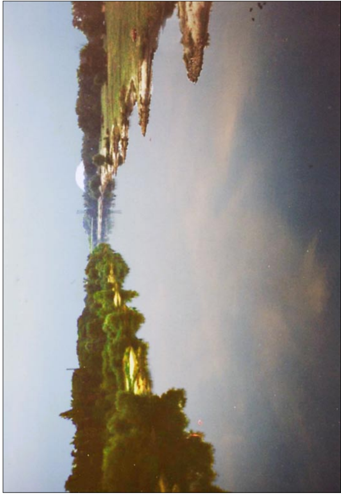
Woda opada na Biskupinie