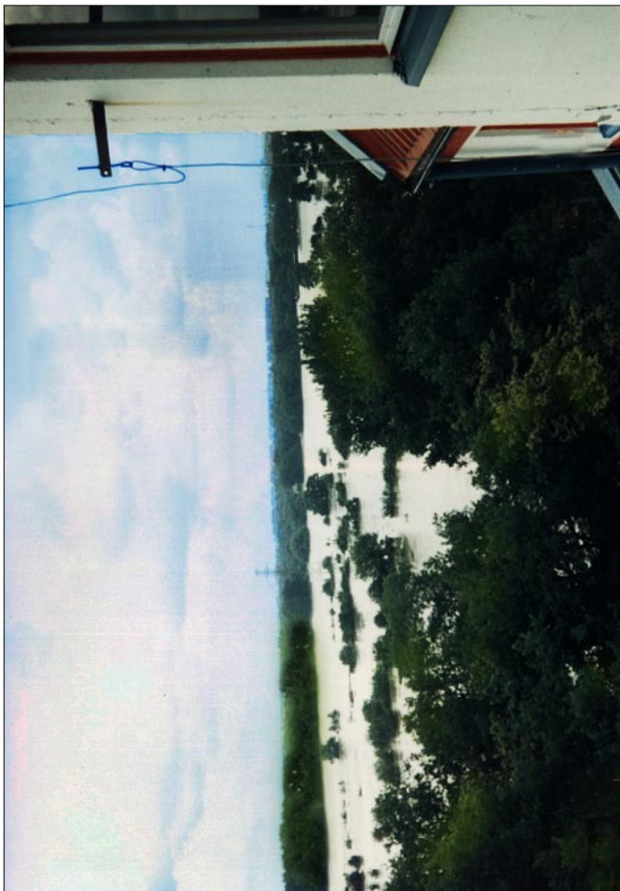
Widok z okna na Kozanowie